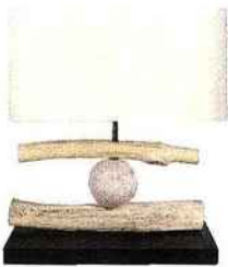
Lampe gamme Nature.