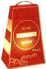
Modèle nomade pour adolescents.