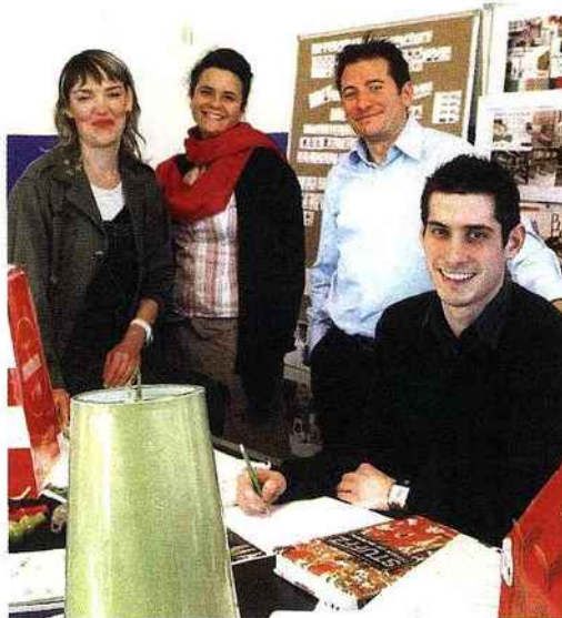
Une partie de l'équipe. Chez Corep, design et marketing s'élaborent en interne.